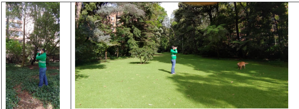
Fotografía 1 y 2. Observación Avifauna Patio Casa Echavarría

Como resultado se registraron cinco (5) especies de aves en el predio Turdus fuscater (Mirla), Zenaida auriculata (Torcaza), Zonotrichia capensis (Copetón), Colibri coruscans (Colibrí Chillón) y Diglossa humeralis (Carbonero), adicionalmente no se registraron nidos de la especie Megascops choliba (Búho Currucutú).