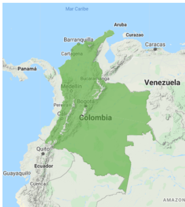
Figura 1. Mapa de distribución en Colombia de la especie Megascops choliba

La especie Megascops choliba , no fue registrada durante los muestreos, ni como especie probable el estudio ambiental presentado por la empresa SOLUCIONES JURÍDICAS & AMBIENTALES INTEGRALES S.A.S, lo cual debe ser replanteado, ya que es probable su distribución en la ciudad de Bogotá. Sin embargo, esta especie es una especie de amplia distribución en la cual, se encuentra desde Costa Rica hasta el nororiente de Argentina, Paraguay y sur de Brasil. En Colombia se encuentra hasta 3000 m de altura sobre el nivel del mar en todo el territorio nacional excepto en la vertiente occidental de la cordillera Occidental (Arango, 2015).